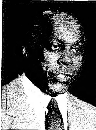
ليون جوردن صديق كلياتون يؤكد انه لم يرض مونيكا على الكتب (ريوتا)